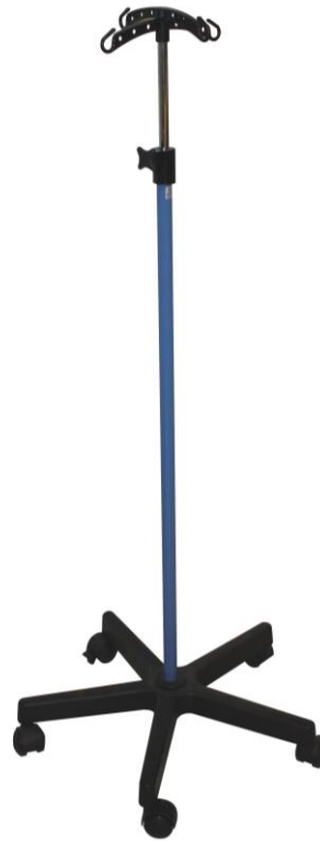
Modèle présenté : PORTE SERUM A ROULETTES / LAGON - 4040130S6

Garantie produit : 2 ans contre tout vice de fabrication